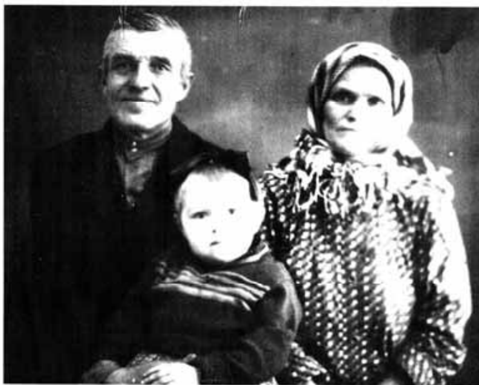
Такими остались в памяти наши родители