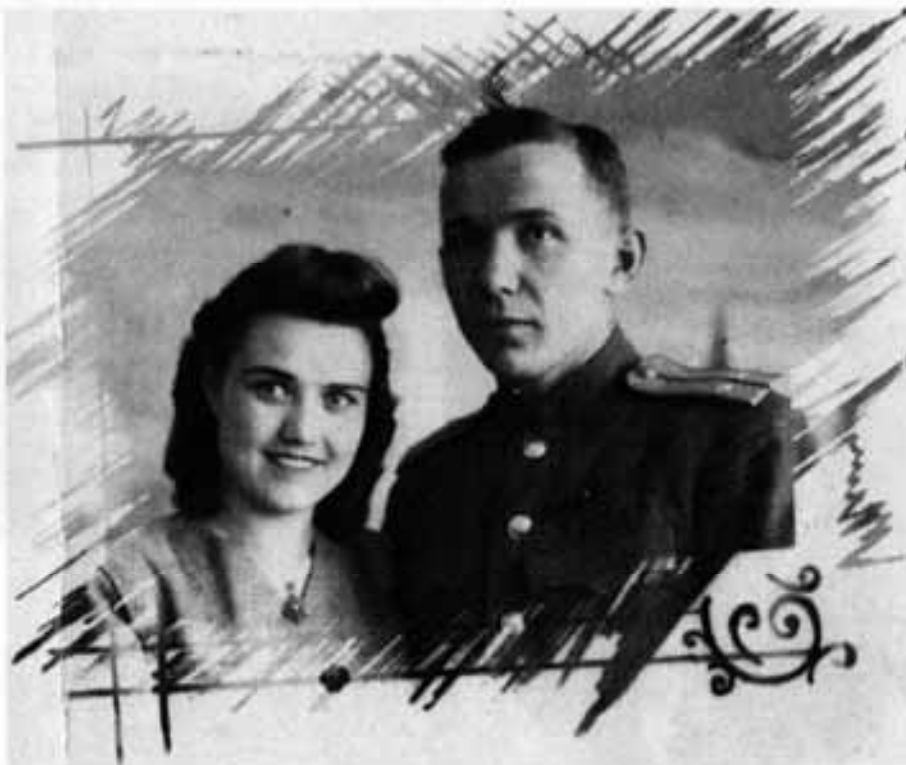
Декабрь 1947 года