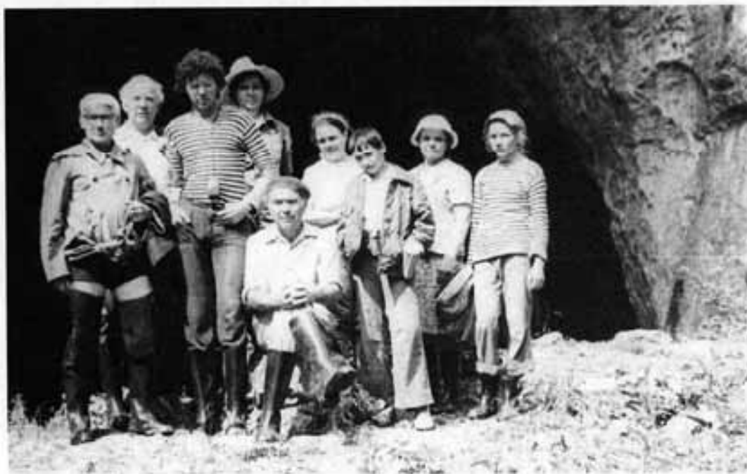
У входа в Капову пещеру