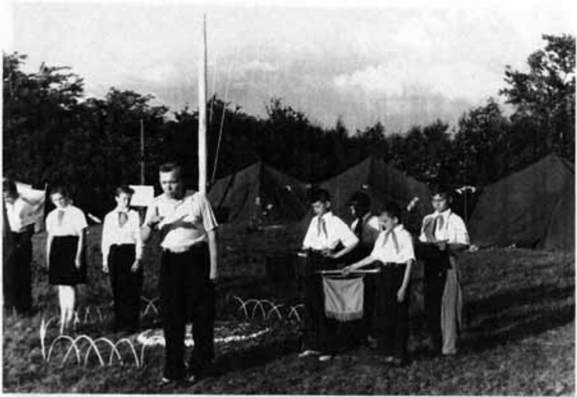
Открытие пионерского лагеря Салаватской школы-интерната