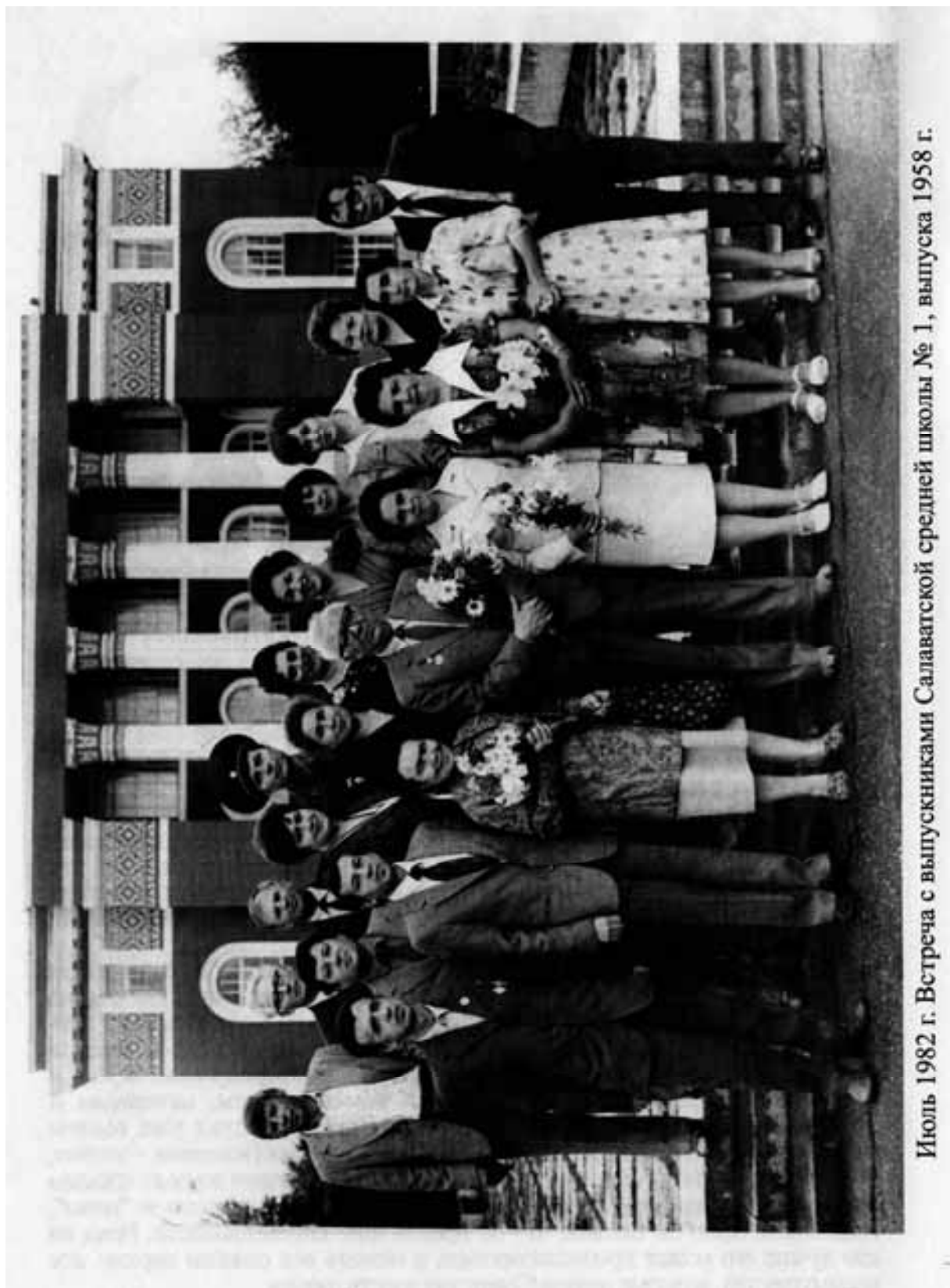
Июль 1982 г. Встреча с выпускниками Салаватской средней школы № 1, выпуска 1958 г.