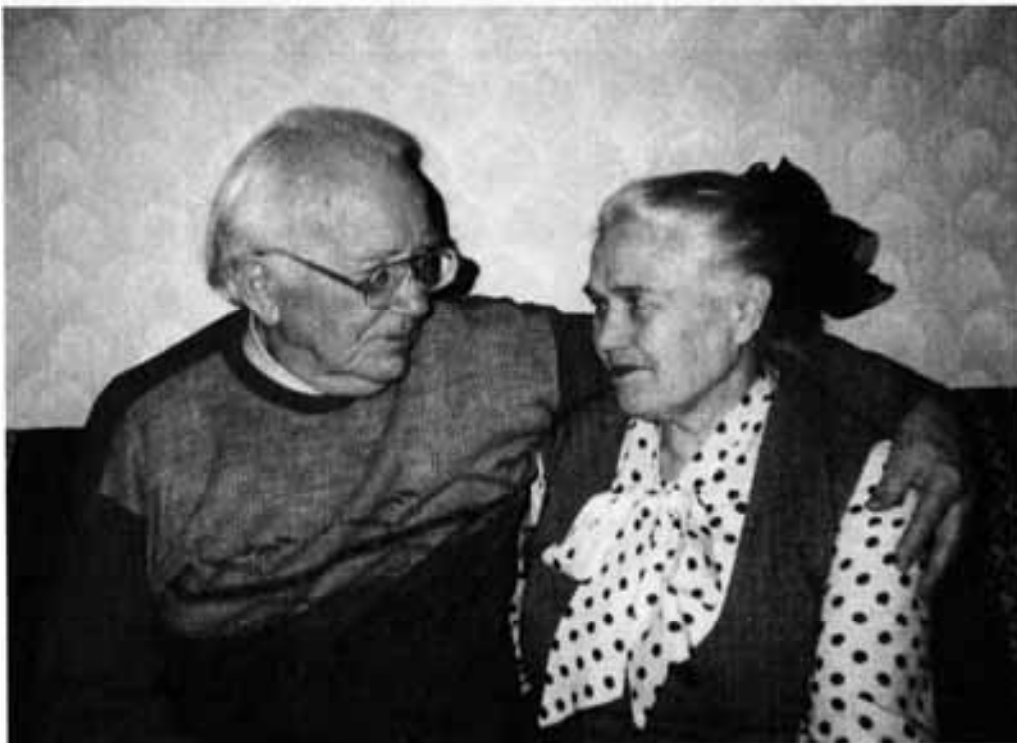
Декабрь 1997 года

Пройден путь от свадьбы до золотой свадьбы